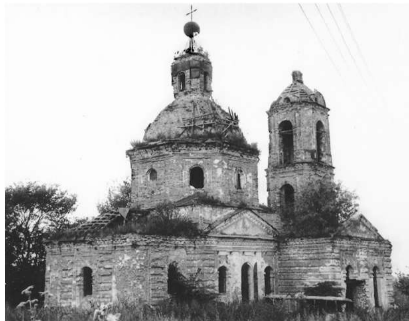
Фото 1990 года

Православное предание гласит, что Ангел Хранитель даётся не только каждому новокрещённому человеку, но и новоосвящённому храму. Ангел не покидает хра-